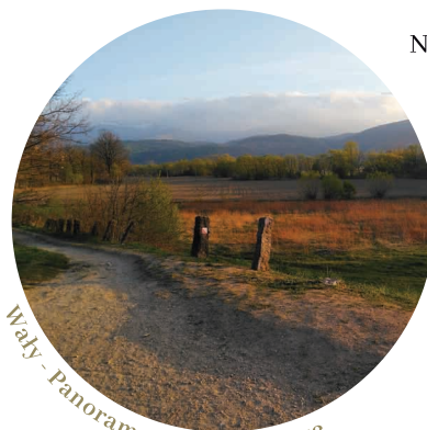
Waly - Panorama na Karkonosze

Mezi Cieplícem a Staniszwem, na okraji lesa se nachází hrob neznámého kněze z období 2. světové války. Velmi záhadné místo, opředené mnoha legend. Nepochybně je, že v něm byl pohřben duchovní, přičemž příčiny úmrtí kněze jsou tématem mnoha příběhů. Dokonce kolují pověsti, že duch zesnulého se vrací na toto místo a děsí okolní obyvatele. Toto místo je uctíváno místními a vždy udržované v náležitém stavu, často je tam možné vidět čerstvé květiny a zapálenou svíčku.