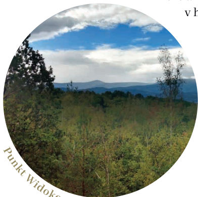
Punkt Widokowy - Panorama

V nejbližší blízkosti hory je vyhlídkové místo Panorama.