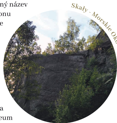
Skaly - Morskie Oko

Vzájemně sousedící parky, které jsou nepochybně atrakcemi Cieplíc. Norský park založil na začátku 20. století majitel továrny pro výrobu papírenských strojů Eugen Füllner, který odděloval výrobní závod od sídliště obydlí zaměstnanců. Současný název je odvozen od pavilonu vztyčeného podle vzoru restaurace v Oslo. Okrasou parku je rybník s kamenným můstkem, nad kterým se vznáší Norský pavilon (Pavilon Norweski), v němž donedávna sídlilo Přírodní muzeum (Muzeum Przyrodnicze).