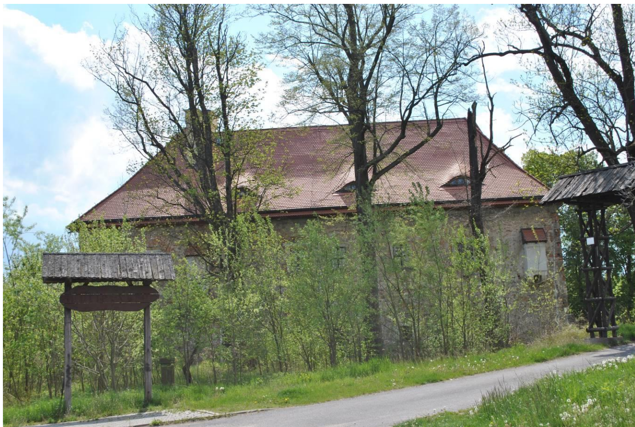
Dwór Czarne