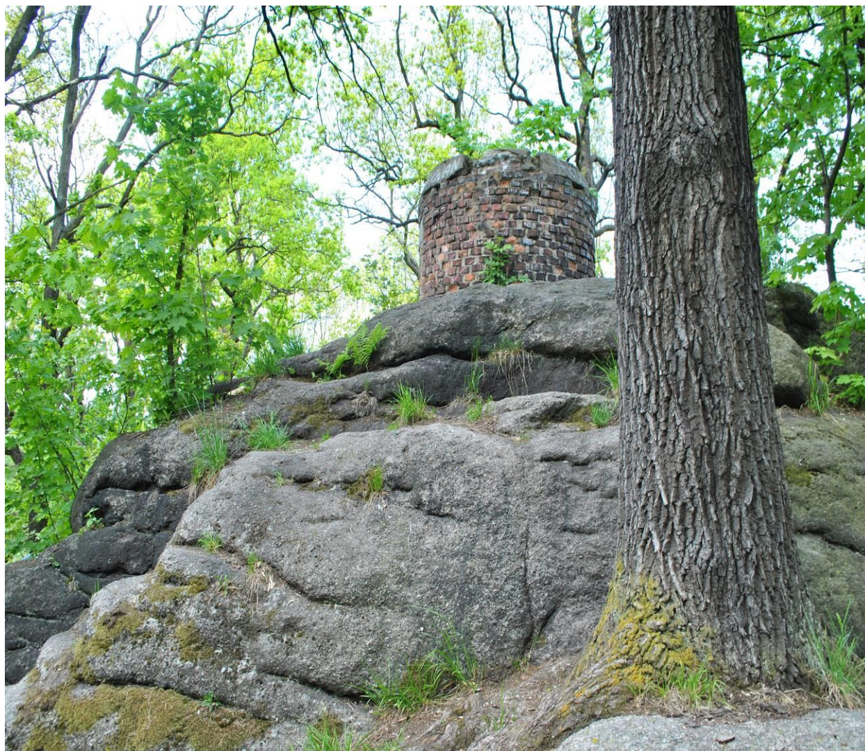
Skałki nad dworcem PKP w Jeleniej Górze

Startujemy z dworca PKP w Jeleniej Górze. Na przeciwko dworca odnajdujemy początek szlaku żółtego. Wchodzimy po schodkach, skręcamy w lewo na Górę Parkową, przechodzimy obok skałek Czarcia Ambona. Następnie idziemy ulicą Podgórze, szlak poprowadzony jest alejkami wokół Wzgórza Partyzantów (414 m.n.p.m). Przechodzimy przez ul. Nowowiejską i skrajem Parku Paulinum oraz ul. Satffa dochodzimy do ul. Sudeckiej. Przechodzimy na drugą stronę, skręcamy w lewo.