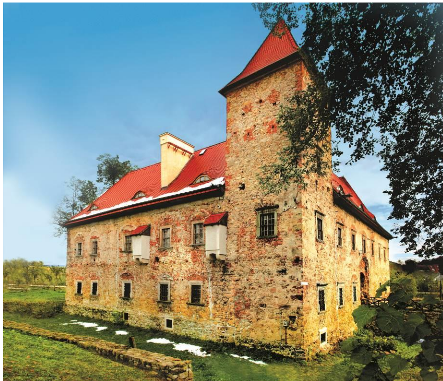
Dwór Czarne.