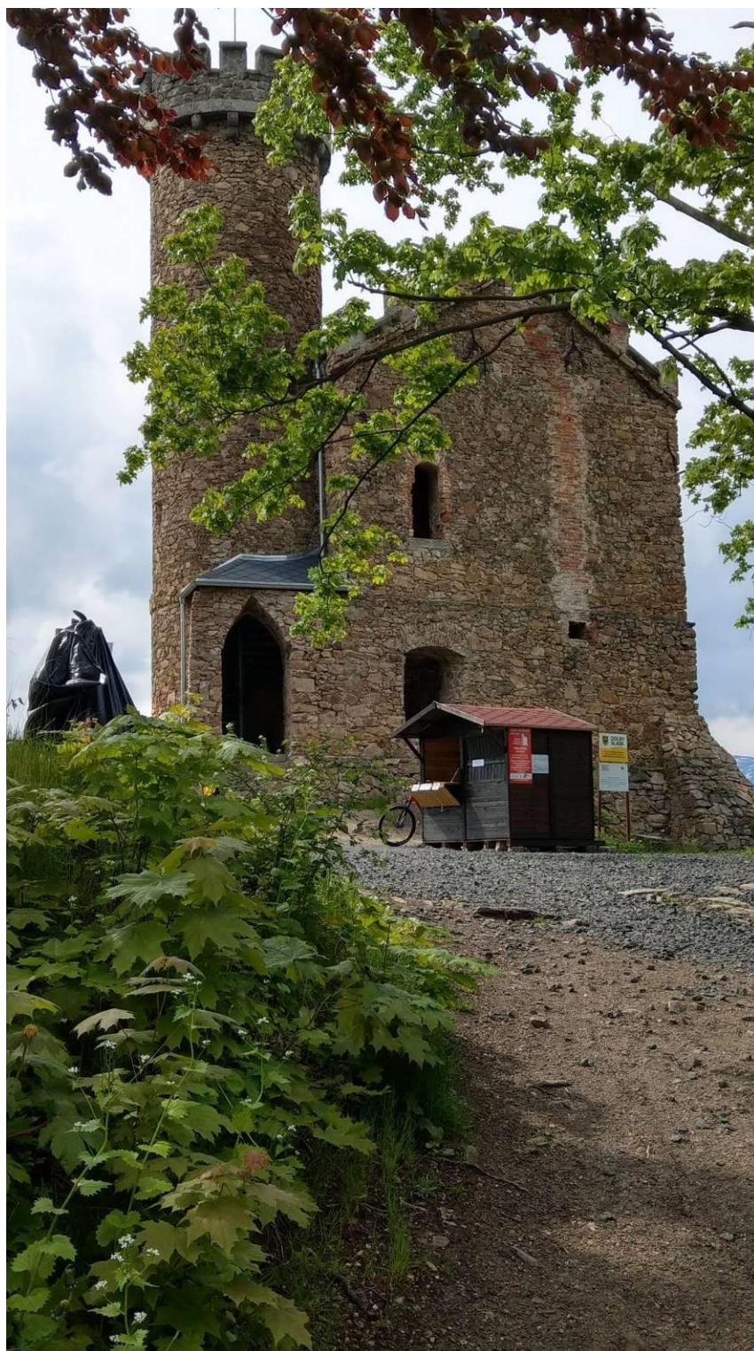
Zamek Księcia Henryka, fot. Waldemar Olech

Schodząc do Stanisłowa kierujemy się nadal szlakiem żółtym w stronę najwyższego wzniesienia Wzgórz Łomnickich – Grodnej (506m n.p.m.). Wzniesienie zaliczane jest do Korony Sudetów Polskich. Powierzchnia szczytowa jest wyraźnie zaznaczona, a najwyższy punkt wzniesienia jest łatwo rozpoznawalny. Walory widokowe tego miejsca docenił Heinrich XXXVIII hr. Von Reuss, właściciel