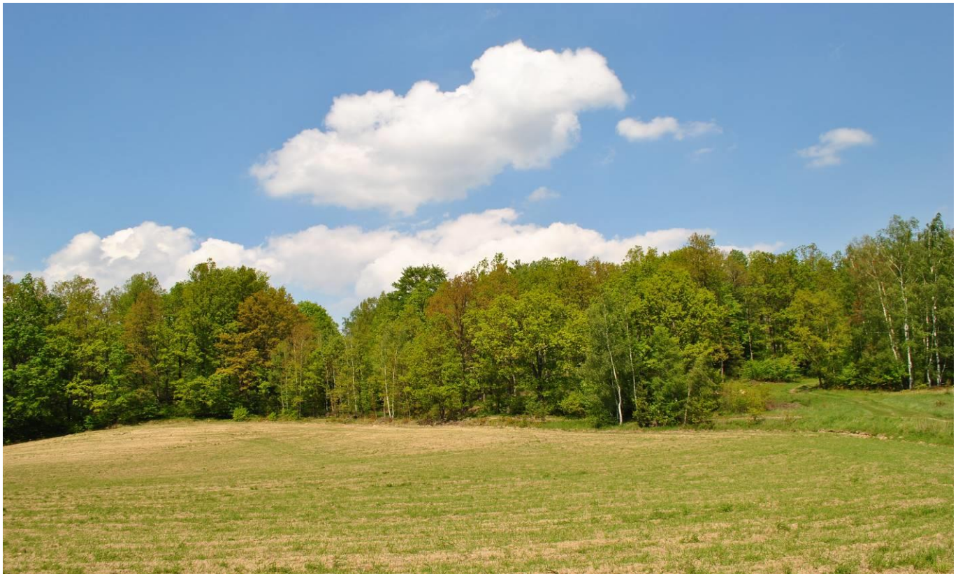
Widok na las mieszany w drodze na Witoszę

Śródleśne łąki porastają liczne gatunki kwiatów. Bystre oko dojrzy również kamienie graniczne z wrytym znakiem krzyża.