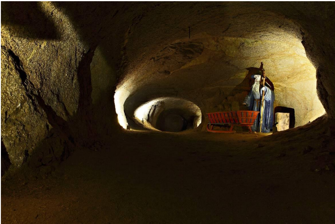
Podziemia Jeleniogórskie, Times Gates Bramy Czasu