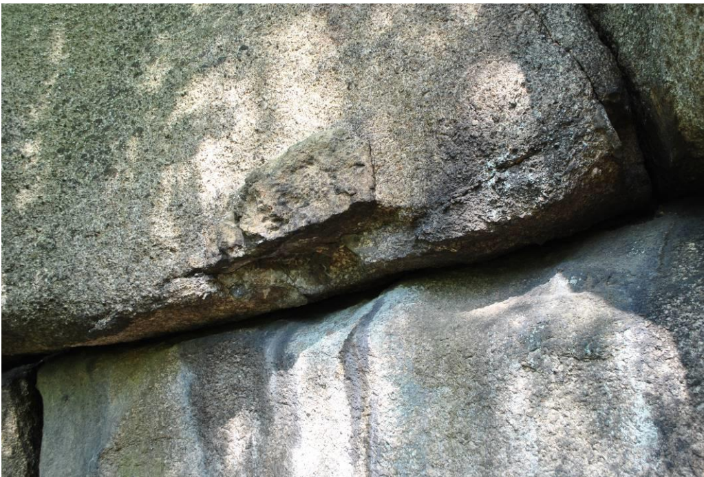
Porwaki, fot. M. Klementowska

Podążamy dalej w kierunku szczytu za znakami żółtymi, które znakarze PTTK nanoszą w widocznych miejscach: na pniach drzew, lub kamieniach.