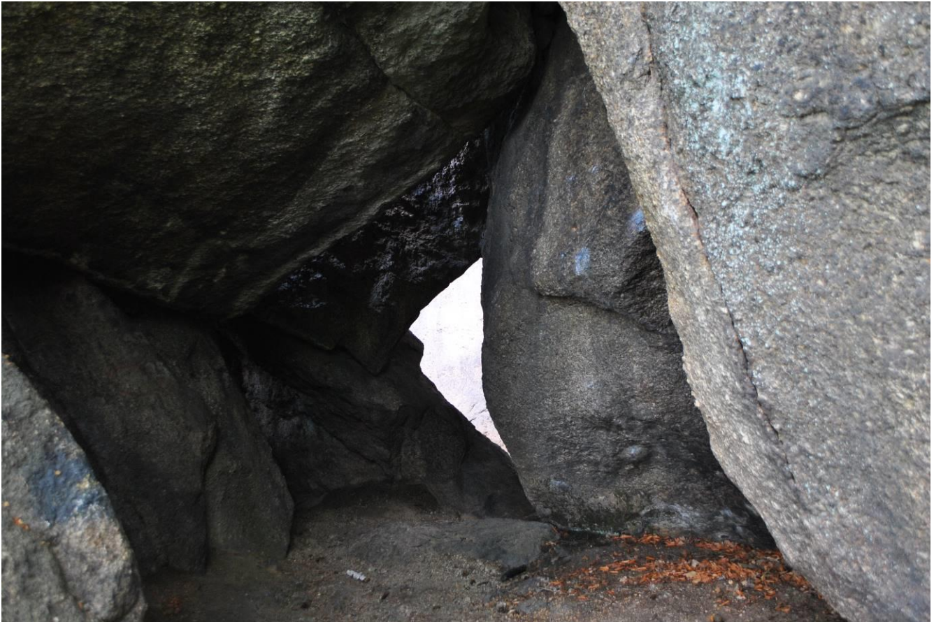
Pustelnia