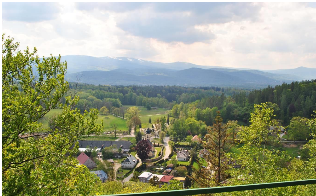
Widok z Witoszy na Staniszków. W tle Karkonosze (Śnieżne Kotły, Szrenica), masyw Wysokiej Kopy w Górach Izerskich.

Schodzimy stromymi schodami do centrum Staniszkowa, jedną z możliwości jest zakończenie wycieczki u podnóża Witoszy i powrót autobusem MZK do Jeleniej Góry. Jednak my proponujemy wycieczkę dalej do przepięknego Zamku Księcia Henryka .