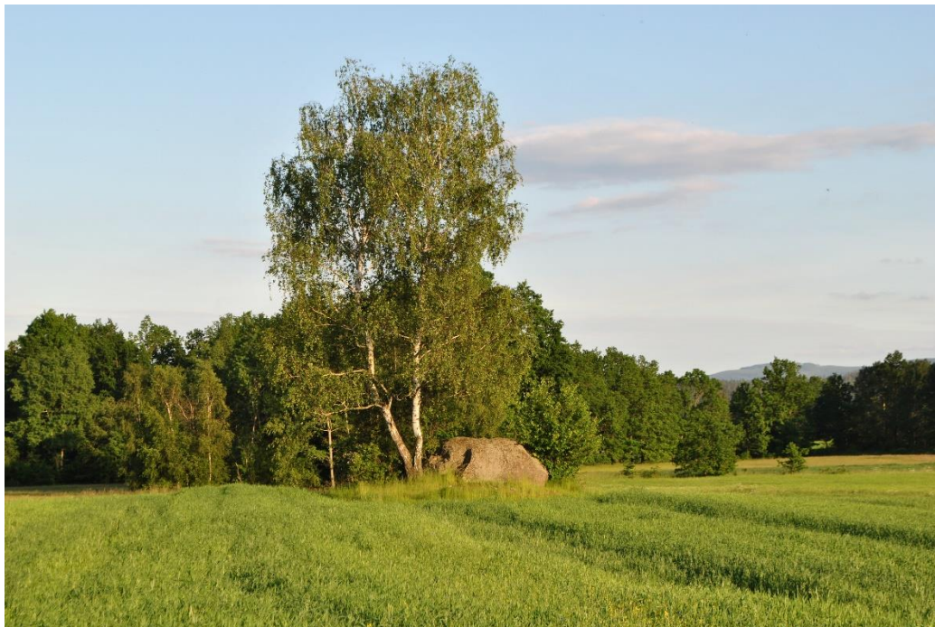
Skałki na trasie tzw. mutony

Za gospodarstwem skręcamy w lewo. Po prawej stronie, w pewnym oddaleniu od drogi mijamy mutony, skałki wysokości kilku metrów, których charakterystyczny podłużny kształt powstał w procesie mechanicznego niszczenia skały przez lodowiec. Po ok. 1 godzinie od wyjścia z Paulinum dochodzimy do mostu na Łomnicy.