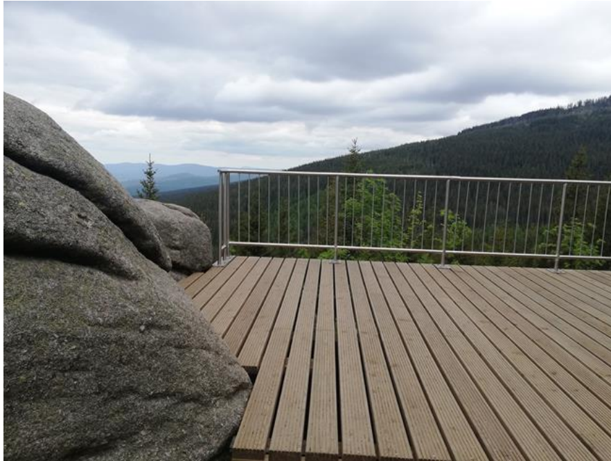
Punkt Widokowy na Skałkach Paciorki

Czy zastanawialiście się, jak powstały te charakterystyczne dla Karkonoszy skałki? Granitowa skałka to jeden z najciekawszych elementów rzeźby tych gór. Za jej powstanie odpowiedzialne są procesy, które rozpoczęły się już 300 milionów lat temu! Wtedy to gorąca magma z wnętrza ziemi wdarła się w otaczające skały, a następnie powoli zastygła, tworząc skałę granitową. Magma krzepła na wielkiej głębokości (8-10 km), a proces ten mógł trwać nawet około 45 milionów lat. Granit jest najbardziej rozpowszechnioną skałą w Karkonoszach. Składa się z trzech podstawowych minerałów: kwarcu, skalenia i biotyty.